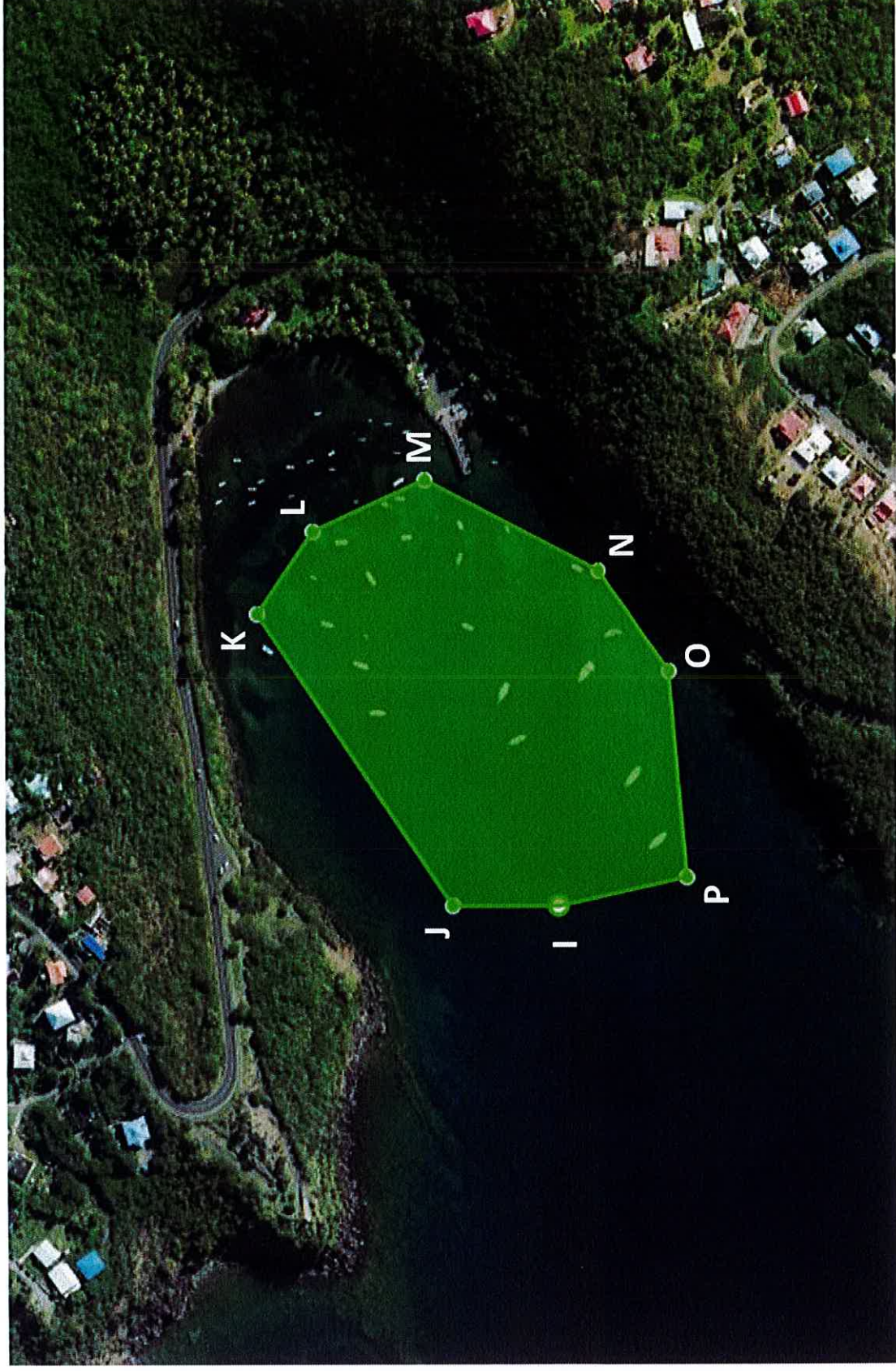
Anse à la Barque